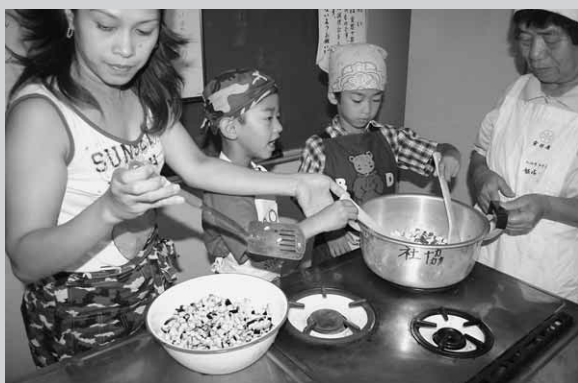
おいしくできるかな

8月4日に村食生活改善推進員連絡協議会による親子料理教室が開催されました。当日は村保健センター栄養指導室に12人の親子が集まり、ナンやりんごヨーグルト作りに挑戦。子どもたちは慣れない手つきで包丁を使い、母親やヘルスマイトの指導でおよそ1時間ほどで見事においしそうな料理を完成させました。