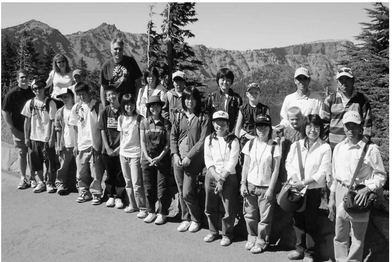
クレーターレイクで記念撮影

平成16年度昭和村中学生海外派遣事業が行われ、昭和中の3年生がアメリカ・オレゴン州イーグルポイントでホームステイを体験してきました。期間は、8月4日～13日までの10日間。12人はホームステイのほか、英語の学習、観光など現地の人との交流をとおしてたくさんのことを学びました。このページでは、その10日間の主な内容を写真で紹介します。