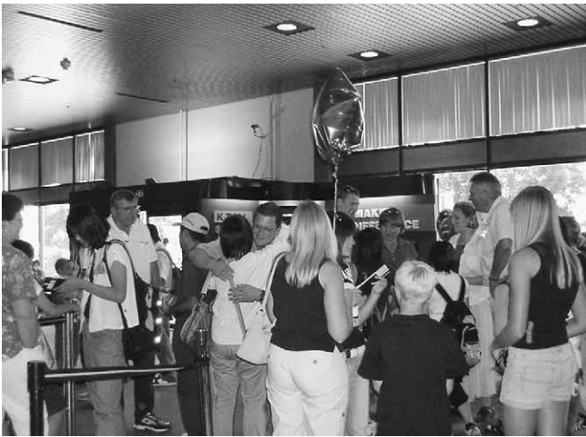
メドフォード空港でホストファミリーとお別れ