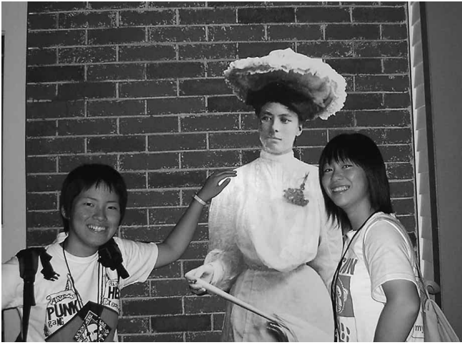
ジャクソンビルでパチリ