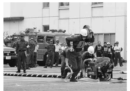
▼ホースをかつぎ火点に向けて全力疾走