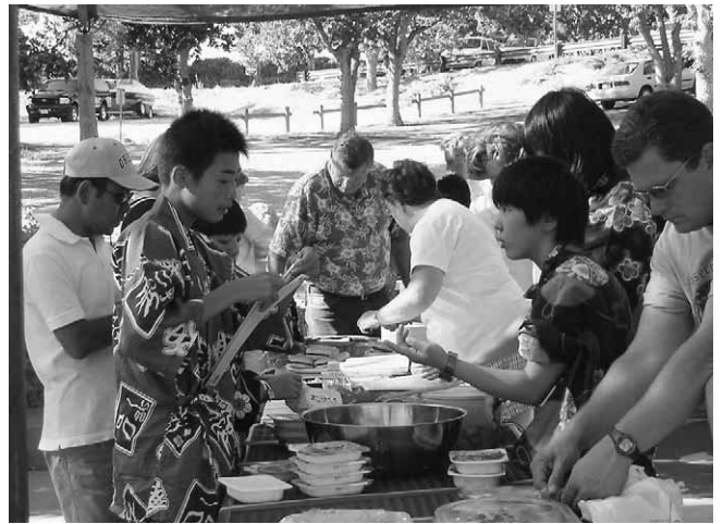
フェアウェルパーティーで日本食を披露