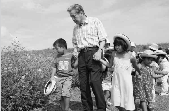
園児と一緒にコスモス観賞

コスモス畑（黄花）が満開になり、春の園児達との約束どおり小寺知事が再び昭和村にやってきました。