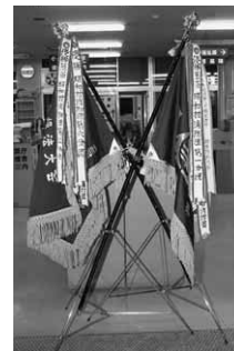
◀大会の翌日、役場玄関に飾られた優勝旗