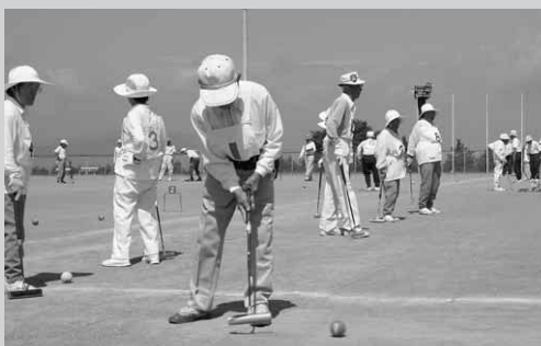
ゲートに向け一直線

これは、生涯スポーツ講習会として行っているもので、体育指導委員が講師となって指導をしています。参加を希望される方は教育委員会事務局☎24-5120まで連絡を。