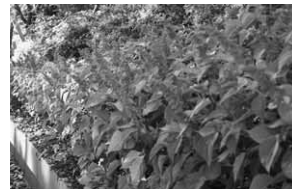
咲きはじめたサルビア

付けを実施したもので、会員たちが種からおこした苗2000株を公園内の管理棟付近や総合運動公園北側入口の道路などに植え付けました。