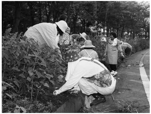
道路沿いのサルビアの手入れを行う役員