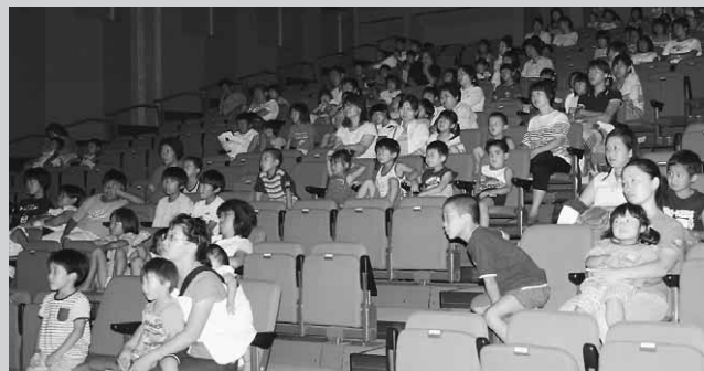
映画に見入る参加者

7月31日に村公民館で夏休み親子映画まつりが開催されました。参加したのは村内外の親子160人で午後7時から2時間で2本の映画を楽しみました。