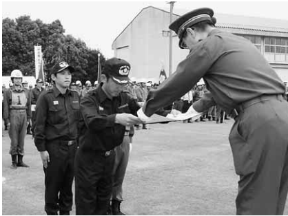
▲優勝で表彰される第3分団