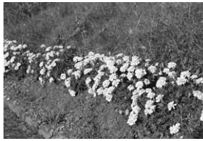
満開のマリーゴールド

若妻会連絡協議会では毎年総合運動公園内にマリーゴールドを植えており、今年も6月28日に苗の植え付けが行われました。この日は会員約90人が参加。100鉢のマリーゴールドがきれいに植え