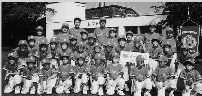
激励を受ける選手達

第35回群馬県少年学童軟式野球大会利根沼田予選が行われ、昭和イーグルスが県大会出場を決めました。