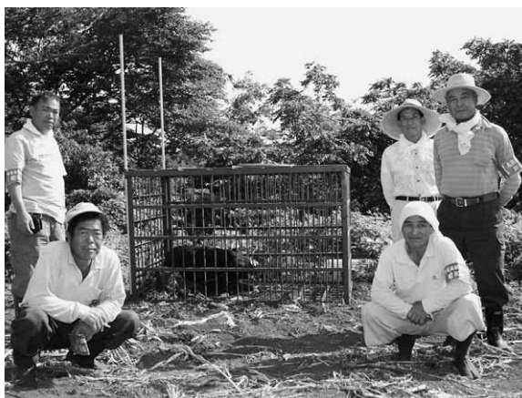
捕獲したクマの前で

村では、クマによる農作物などの被害を減らす為、随時捕獲を行っています。村内でクマを見たり、クマによる被害があったと思われる場合には村産業課（☎24-5111内線28）まですぐにご連絡ください。