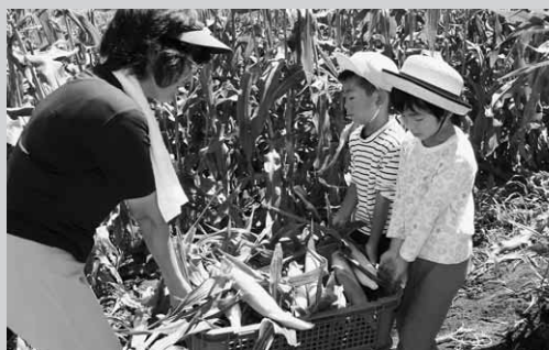
うんしょ、うんしょ