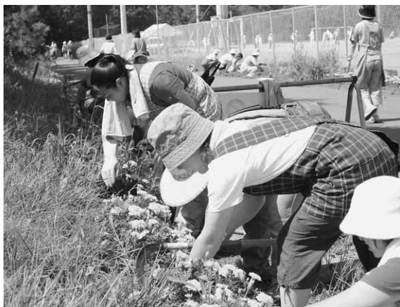
カマを片手に草むしりをする会員たち

付けられました。このマリーゴールドは今満開の時期を迎えており、総合運動公園を訪れる人たちの目を楽しませています。