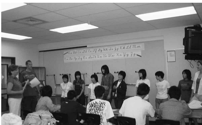
スラング（俗語）を勉強