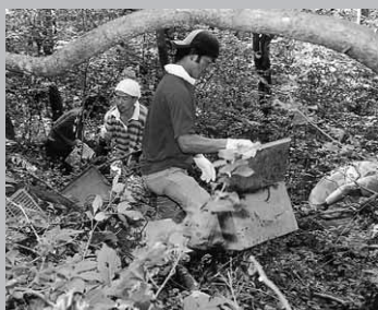
大量の粗大ゴミが投棄されていました。

三代目は昨年7月に結成され、現在は10人で活動中。主な活動として、月に一度の勉強会をしています。