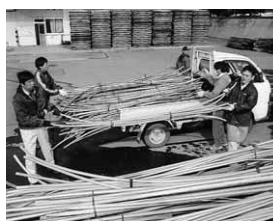
パイプの回収の様子

12月20日は群馬県北部に大雪警報が発令。およそ一晩降り続け、40センチ～70センチの積雪量に。村内でビニールハウスによる