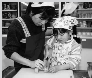
上手にきれたかな

この後、親子で作った3品の力作を試食。みんな笑顔でおいしそうに味わっていました。