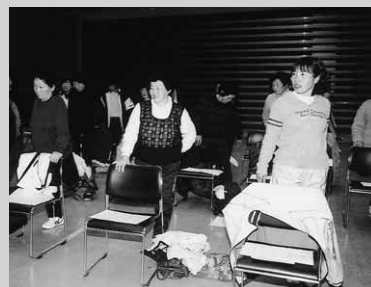
ストレッチも入念に