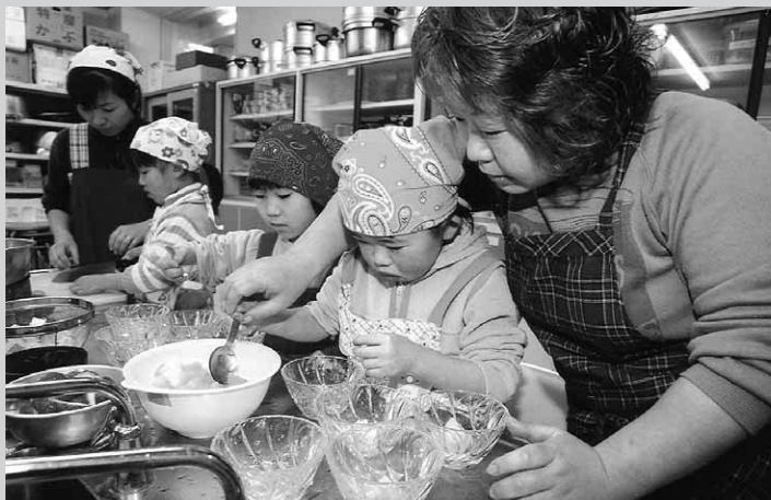
お母さんはやっぱりうまいね