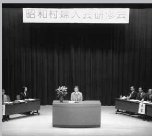
100人が参加しました