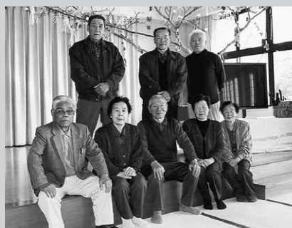
作業を行った役員ら

昭和の湯の休館日であるこの日、作業には同連合会の役員ら8人が参加。ステージ上には、赤や白の繭玉やみずぶさの花で作った「より花」などが飾り付けられました。