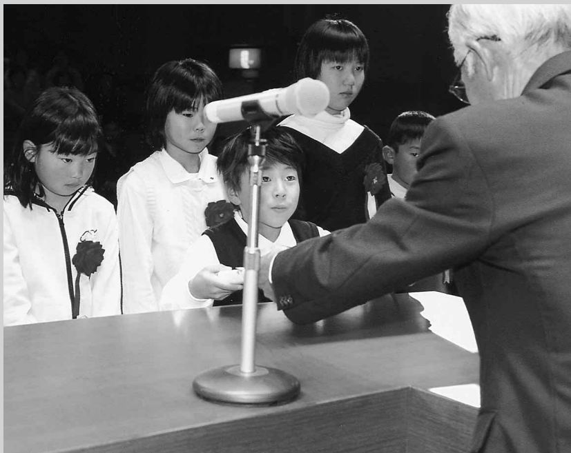
賞状を受けとる受賞者

第22回わたしと家族作文発表会が1月17日、村公民館多目的ホールで行われました。