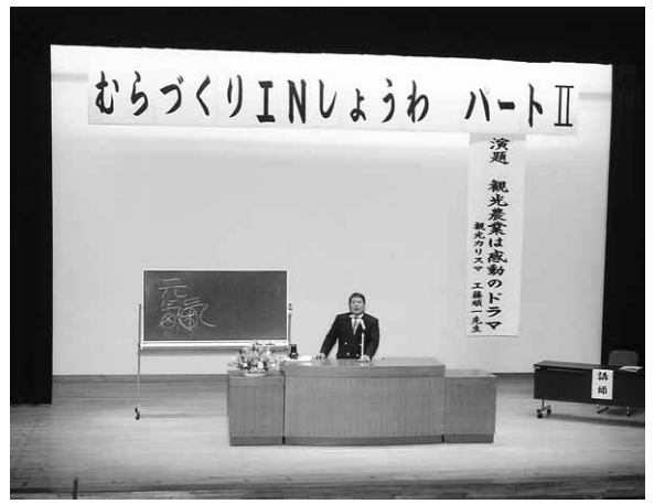
2日間に分けて行われた講演会