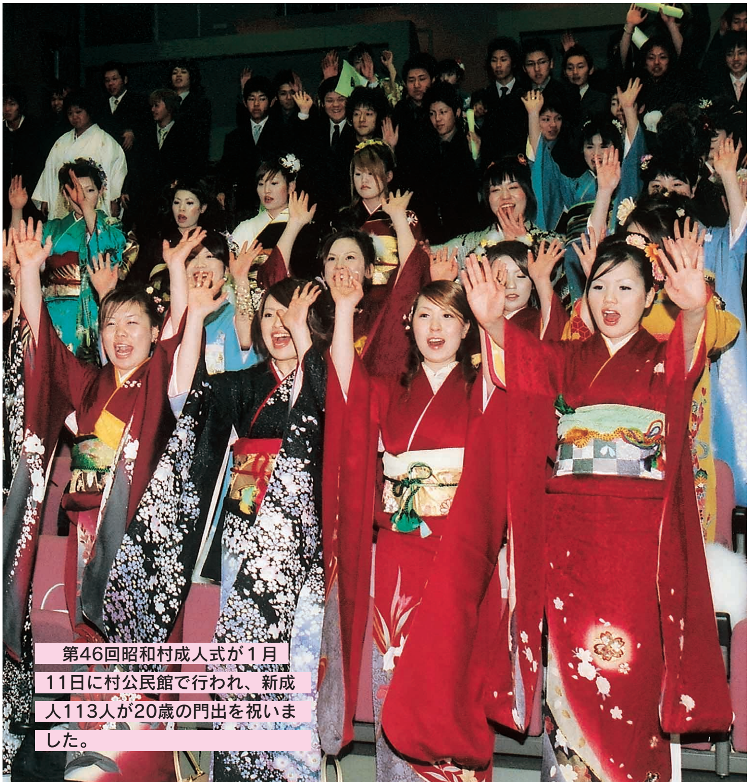
第46回昭和村成人式が1月11日に村公民館で行われ、新成人113人が20歳の門出を祝いました。