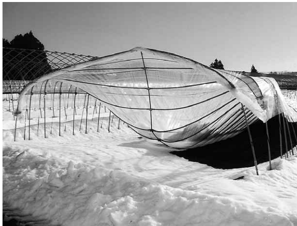
倒壊したビニールハウス