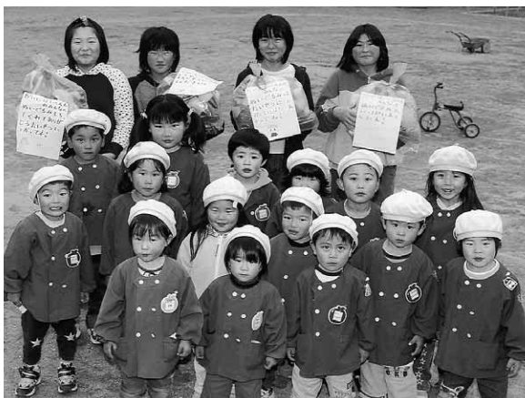
小学生のお姉さんとハイチーズ

園児たちは、突然のたくさんのぬいぐるみのプレゼントに大喜び。さっそく袋から人形を出して、楽しそうに遊んでいました。