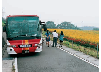
観光バスもたくさん来ました

雑草を除去し、開花を待ちました。 それから1か月後の9月中旬、黄花コスモスが一齐に開花。関越自動車道から見える一面の黄色いコスモスのジュウタンに、連日、観光バスが畑へ。遅咲きですが、ひまわりも開花し、観光客やカメラマンなどたくさんの方の目を楽しませました。