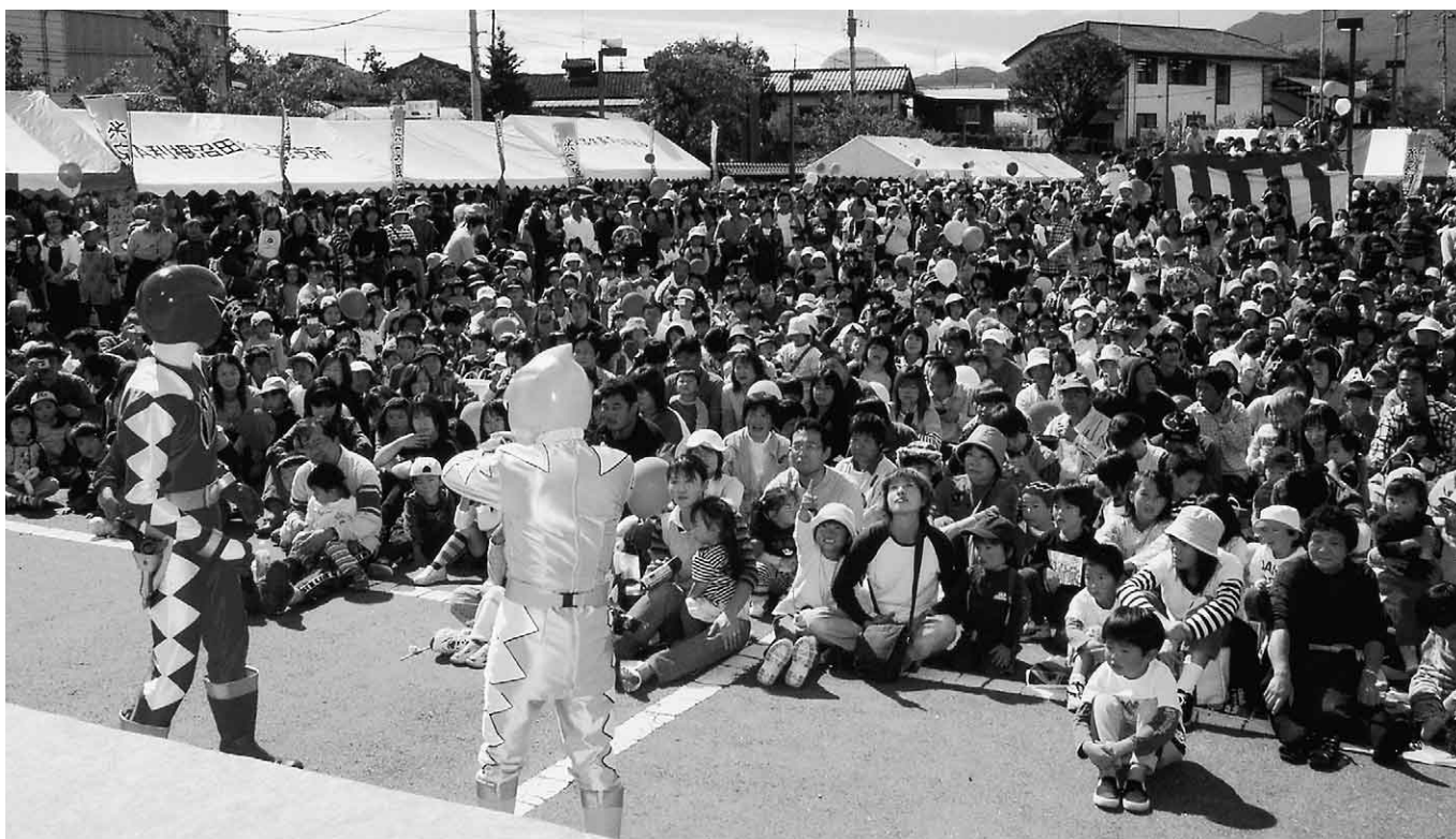
親子連れてにぎわったキャラクターショー