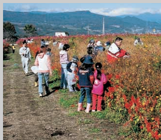
子どもたちも協力してくれました

花いっぱい運動は、来年度も実施する予定です。作業の開始時期は来年の初夏ごろ。誰でも参加できますので、皆さんもぜひ参加してみてくださいか。