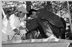
上手にドリルが打てるかな

また、アウトドアクッキングとして、ダンボールでのくん製づくりにも挑戦。子どもたちは、手作りの味に「おいしい、おいしい」と舌鼓を打っていました。