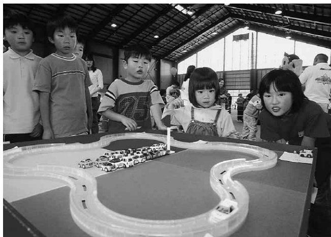
多目的屋内運動場は子どもたちでいっぱい