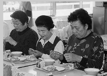
給食の味はいかが?

午前中は、校長先生の講話や授業参観で学習。お昼は児童たちとともに、おいしく給食を味わいました。午後は、児童たちとスポーツで交流。ペタンクやグランドゴルフ等で、子どもたちと笑顔でふれあいました。