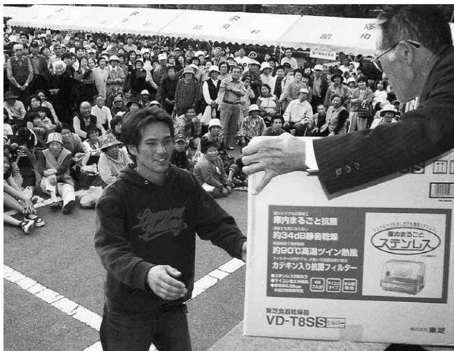
たくさんの賞品が当たりました（大抽選会）