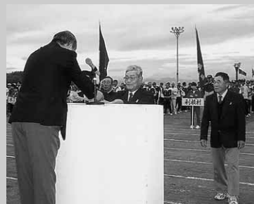
表彰される村選手団の関係役員

第41回利根郡民体育大会が9月23日～10月12日の間、3日間に分けて行われ、みごと昭和村が第1回大会以来の総合優勝に輝きました。