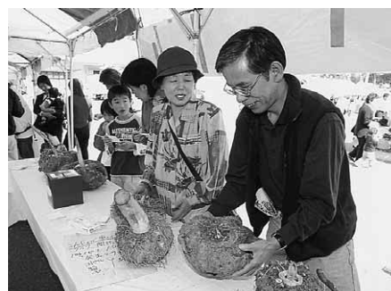
どの位かな？（こんにゃく重さ当て）