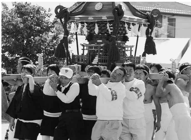
威勢よく練り歩いた入原みこし