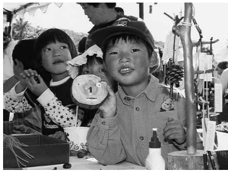
上手に出来たよ！丸太コースター

来場者は昨年を大きく上回るおよそ13,000人。イベントの目玉となる5,000人分のコンニャク大鍋は、わずか3時間あまりで空っぽに。そのほかキャラクターショーや大抽選会など、来場者は昭和の秋をそれぞれ満喫していました。