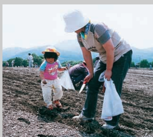
たくさんの親子が参加

7月5日に実施。各保育園・各小学校・一般に区分けし、保育園は黄花、各小学校・一般は3色のコスモスの種をまきました。