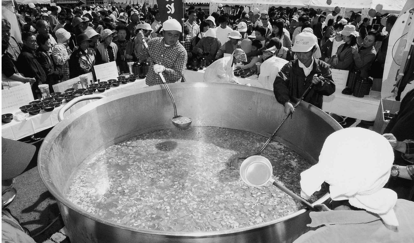
5,000人のコンニャク鍋は3時間でからっぽに