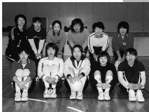
昭和村 バレー部女子