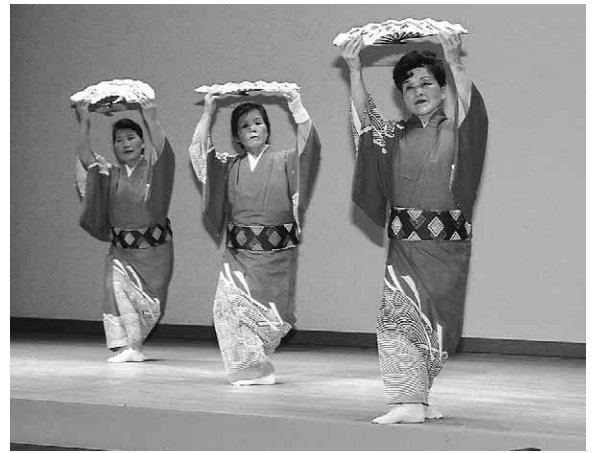
あてやかな踊りを披露