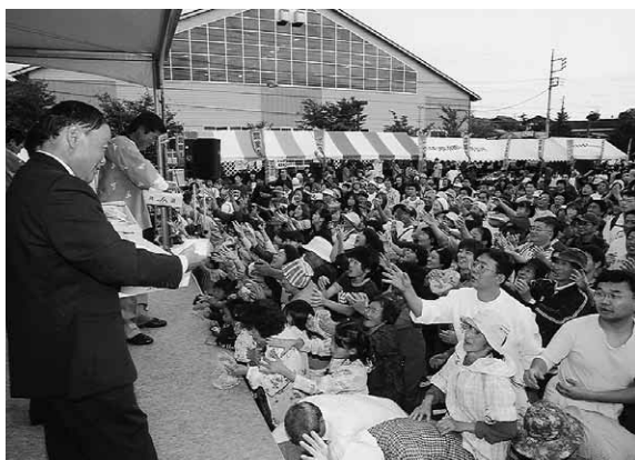
こっち投げて～（投げ餅）