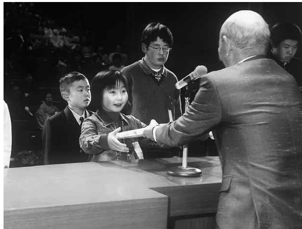
表彰される受賞者