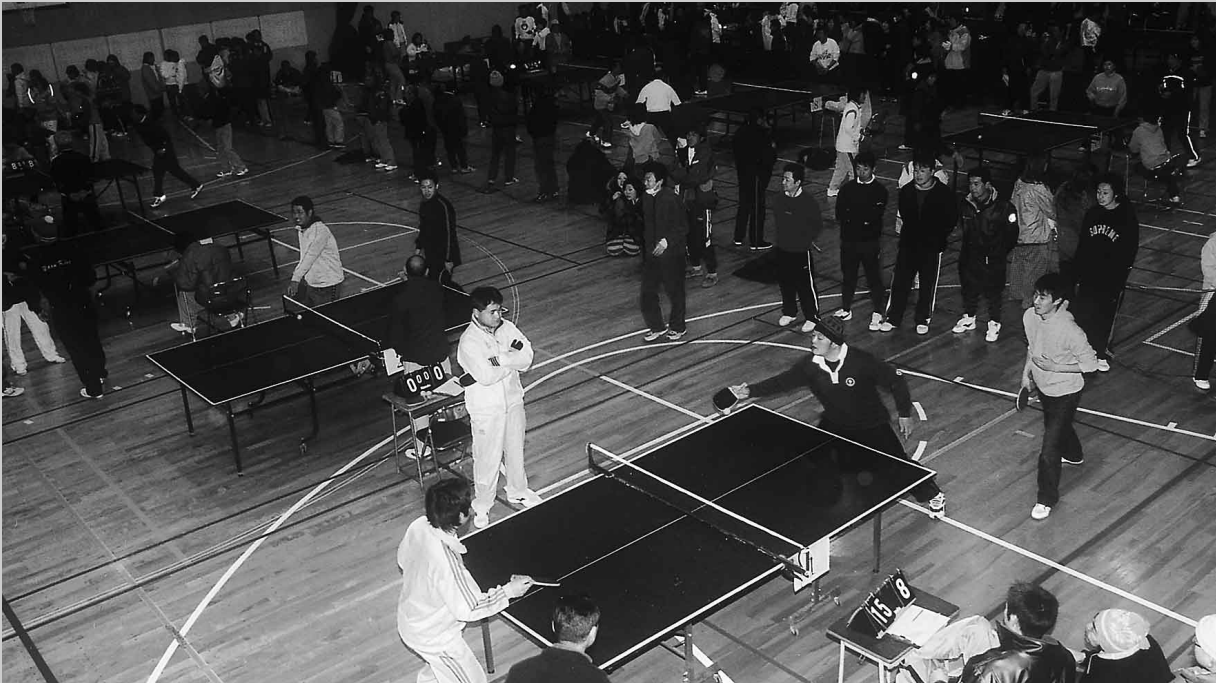
好プレー・珍プレーが続出