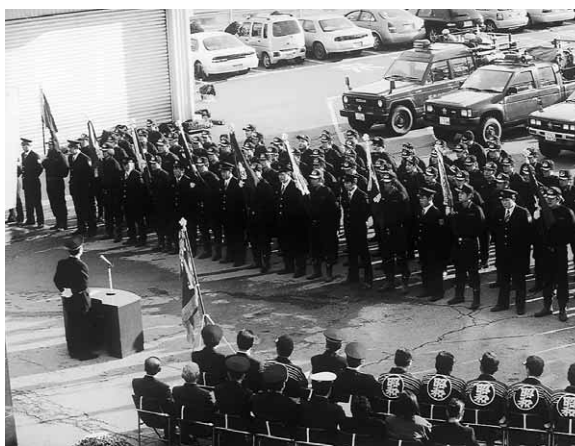
各分団が勢ぞろい