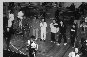
応援にも熱が入ります