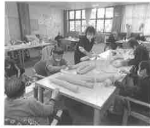
デイサービス食レク

決算額6,797万円 法令を遵守しながら、要介護者・要支援者及びご家族の方々との信頼関係を大切にして利用者個々のニーズに適切に対応したサービス提供を目指しました。 ●居宅介護支援事業、訪問介護事業(訪問型サービス)、地域密着型通所介護事業(通所型サービス)