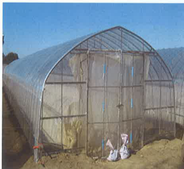
(パイプハウス 100 m 2 あたり)