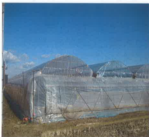
(エコ/ミーハウス 100 m 2 あたり)