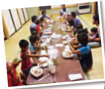
子どもたちの面倒は旦那さんにおまかせ (写真は昨年の様子)