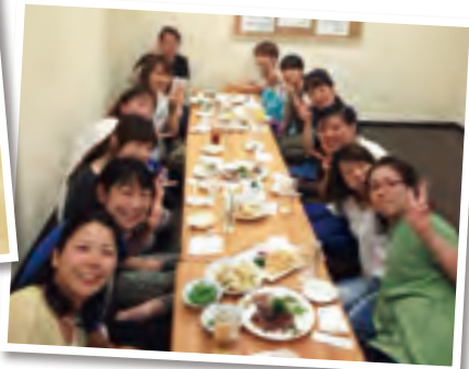
楽しいひとときを過ごす若妻たち