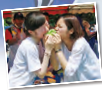
農業委員会が用意した朝採りレタスにかぶりつく参加者たち

このイベントは、村の美しい景観や農村風景、安心安全な野菜を村内外にPRし、村民の健康増進の意識向上とマラソンを通じた交流を目的に開催されたものです。会場では農業委員会のメンバーが、朝採りの新鮮レタスで参加者へのおもてなしを行いました。