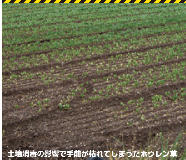
土壌消毒の影響で手前が枯れてしまったハウレン草