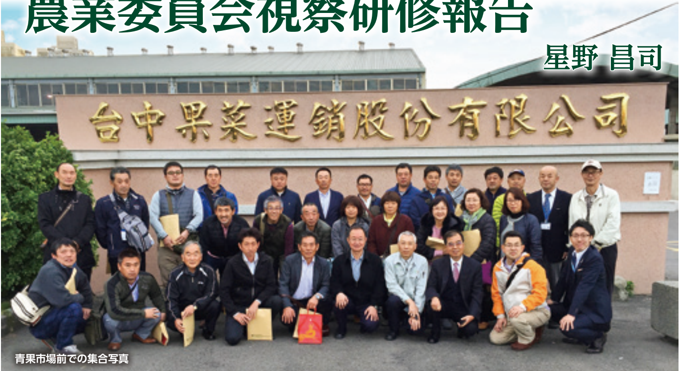
青果市場前での集合写真

平成三十年一月十四日から十七日まで、農業委員二四名、事務局二名で台湾の視察研修に行ってきました。