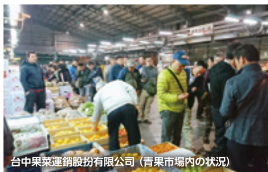
台中果菜運銷股份有限公司 (青果市場内の状況)

でした。市場外取引も多く、生産者とスーパーや料理店が直接取引をするケースもかなりあるそうです。