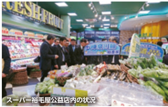
スーパー裕毛屋公益店内の状況

その後、台湾国内に三店舗のスーパーを展開する裕毛屋を訪問し、農産物等の販売状況を見学させていただきました。裕毛屋はターゲットの客層を在台湾の日本人や台湾の富裕層に絞っ