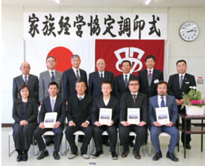
新しく結んだご家族

農業委員会では、農業経営者やその家族が将来に希望を持ち、安心して農業に従事できるように、家族内のルールをつくる家族経営協定の締結を推進しています。