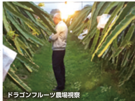
ドラゴンフルーツ農場視察