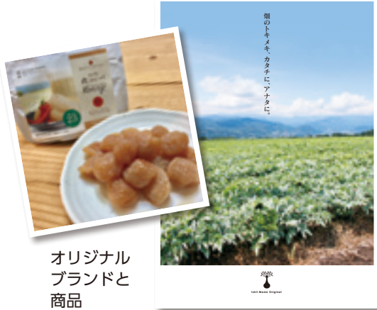
オリジナルブランドと商品

20代前半に南米旅行へ行きました。標高3810mに位置するチチカカ湖、富士山より高い位置にある湖に浮かぶタキレーという島で一生菌を磨